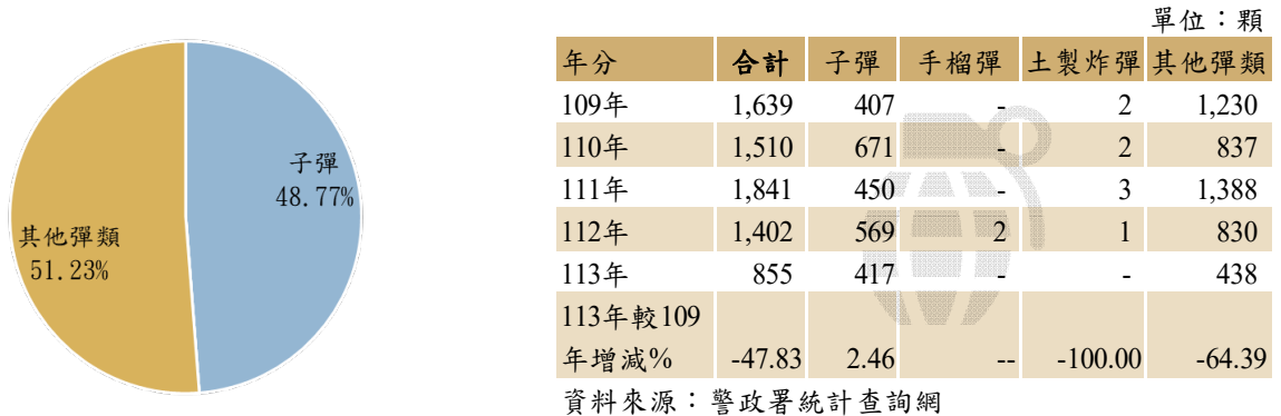
表 3 109 年至 113 年臺南市查獲各類彈藥數量

彈藥種類可分為，子彈、手榴彈、土製炸彈及其他彈類 2 。113年本市查獲彈藥數量共 855 顆，為六都第三低，其中以其他彈類 438 顆(占 51.23%)為最多，子彈 417 顆(占 48.77%)次多，手榴彈及土製炸彈則無查獲。與 5 年前相比，113 年本市查獲之彈藥數較 109 年減少 784 顆(減少 47.83%)。